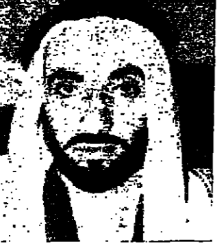
الشيخ زايد بن سلطان

الكويت - اذاع رايو الكويت مساء امس نص بيان مشترك صدر عقب اجتماع عقده امس الاول بين الشيخ زايد بن سلطان حاكم امارة ابو ظبي والشيخ راشد بن سعيد آل مكتوم حاكم دبي جاء فيه ان الحكامين تابعيا بحث مستقبل منطقة الخليج العربي بقصد الاتفاق على اسس توحيد امارات المنطقة لضمان المحافظة على الاستقرار فيها وتحقيق المستقبل الافضل لشعبها .